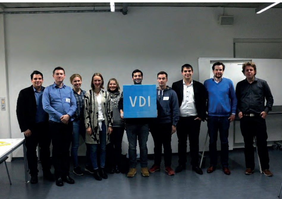
Teilnehmer des Workshops

Mitglieds tragen zur Gruppendynamik bei? Welche Vorteile bringen diese Charaktereigenschaften?