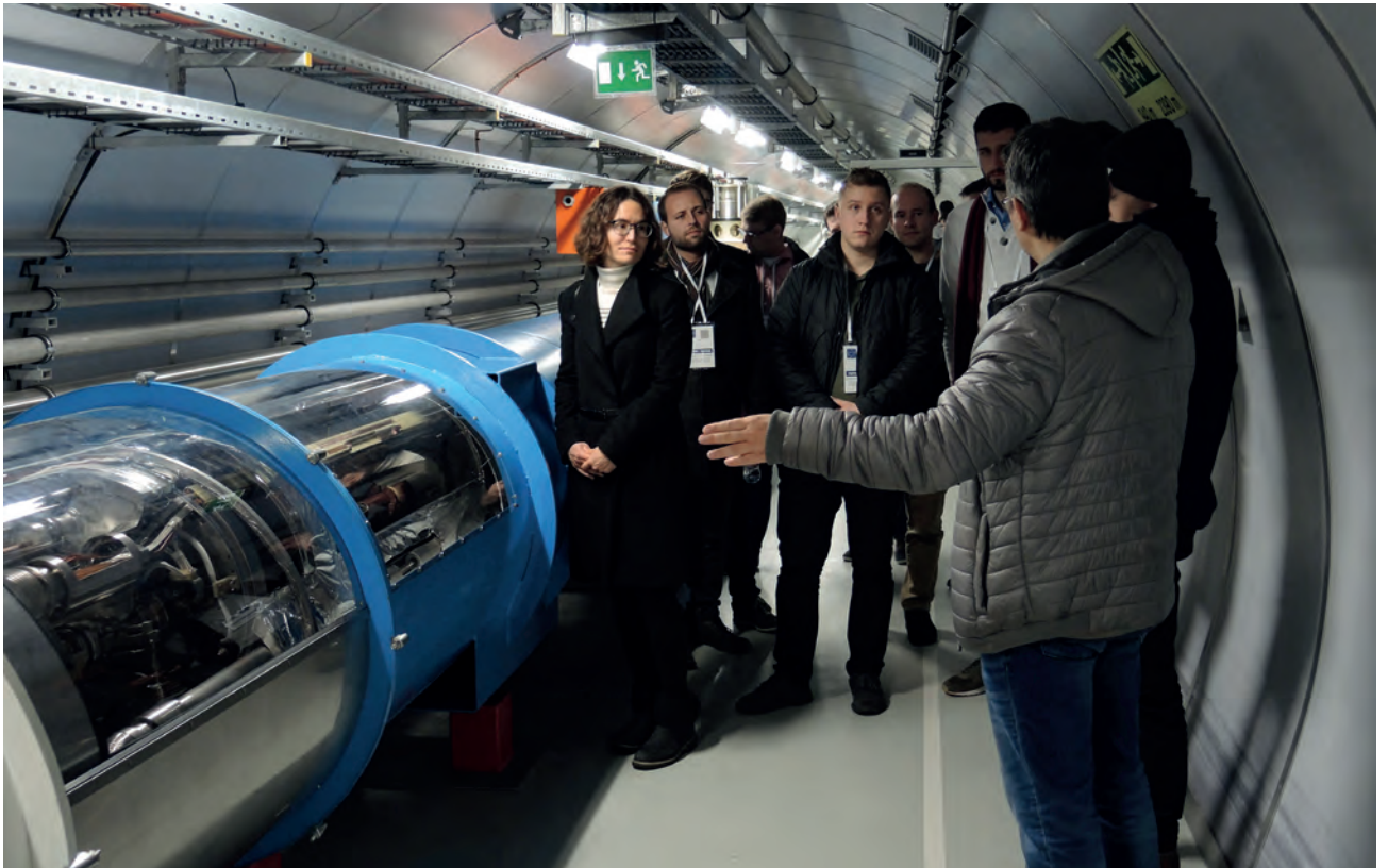
Modell eines Teilchenbeschleunigers im CERN

lernten wir die Arbeitsweise der UN besser kennen, besichtigten verschiedene Säle, in denen die Delegierten der 193 Mitgliedstaaten gemeinsame Lösungen für internationale Probleme diskutieren und wir lernten viel über die Geschichte der Vereinten Nationen, sowie über den Standort Genf.