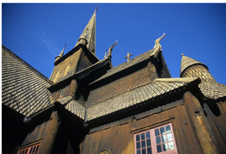
Bild 3 Die Stabkirche in Lom, Norwegen, gehört zu den ältesten erhaltenen Holzbauwerken in Europa. Auch sie wurde in der zweiten Hälfte des 12. Jahrhunderts gebaut. Bei Stabkirchen wird durch die vorgelagerte Fassade die Tragkonstruktion dauerhaft vor Staunässe und Pilzbefall geschützt.

Die Stabkirche von Borgund in Norwegen (Titelbild) ist eines der ältesten Holzbauwerke Europas. Die zum Bau verwendeten Bäume wurden im Winter 1180/1181 gefällt. Durch konstruktive Maßnahmen wie dem Schutz der Tragkonstruktion vor Witterungseinflüssen und durch geeignete Schutzanstriche kann das Holz vor dem Abbau geschützt werden. Dieser erfolgt vor allem, wenn die Feuchte zwischen 20 und 60 % beträgt. Unter-