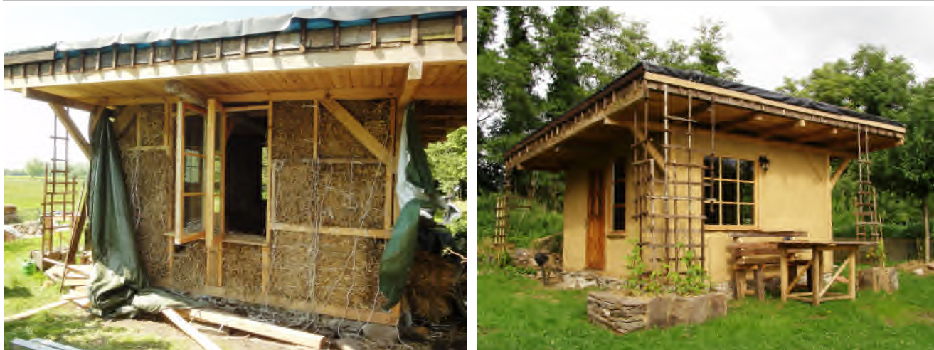
Bild 2 Strohhallenhaus in nicht-tragender Bauweise. Die Gefache eines Holzfachwerks werden mit Strohbällen ausgefüllt. Als Verputz wurde ein Lehmputz gewählt, der durch einen großen Dachüberstand und Begrünung vor Schlagregen geschützt wird.