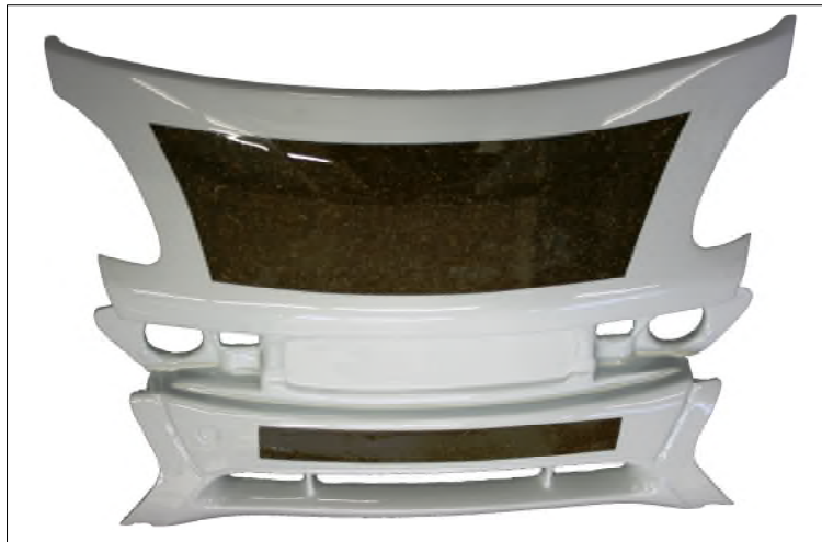
Bild 6 Das Integralbauteil „Haube und Frontpartie“ des Smart Fortwo wurde an der FH Bingen vollständig aus biogenem Duroplast hergestellt. Die wichtigsten Eigenschaften dieses Stoffes sind der hohe Anteil nachwachsender Rohstoffe, die niedrige Dichte und äußerst niedrige organische Emissionen.

Weiterführende Literatur Türk, O.; Stoffliche Nutzung nachwachsender Rohstoffe , Springer Vieweg, Wiesbaden 2013