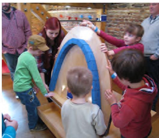
Experiment Kettenlinie Die Bilder zeigen den liegenden Aufbau und das Hochschwenken des Bogens mit der Stützplatte. Nach dem die 90° erreicht waren, wurde die Platte wieder in die Horizontale zurückgeklappt und der Bogen stand von alleine.

• Winkelspiegel, zwei Spiegel sind von 180° bis zu 22,5° zueinander schwenkbar, welche Bilder entstehen?