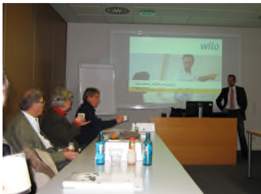
Theorie und Praxis: Erläuterung der Pumpengrundlagen, Vorbereitungen zum Besuch der Elektronikfertigung. Gegen mögliche statische Aufladungen mussten die Schuhe vorher geerdet werden.

Am 14.11.2013 begann unsere diesjährige Fahrt zu einer der bedeutendsten Firmen für Umwälzpumpen, zu Wilo nach Dortmund. Das Programm sah zwei Werksbesichtigungen vor, einmal die Pumpenproduktion und zum zweiten die Elektronikfertigung. Beide Werksbesuche waren sehr interessant, alles wurde uns auch im Detail erklärt. Um in die Elektronikfertigung zu gelangen, mussten wir erst besonders geerdet werden. Sonstige Programmpunkte waren die Erläuterung der Pumpengrundlagen, ohne die ein Fachplaner keine Pumpen auslegen kann, das Wilo-