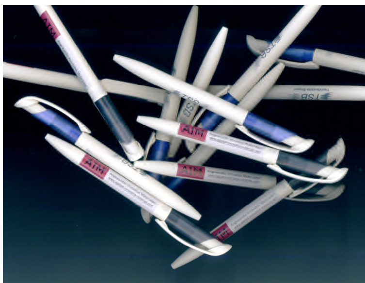
Bild 1 Kugelschreiber aus Celluloseacetat, einem organischen Celluloseester. Die Hülse ist aus Biokunststoff und der biogene Anteil am Gesamtprodukt beträgt 80 %.

Die Erzeugung von Seide geht mit der Aufzucht des Maulbeerbaum-Seidenspinners einher. Die Kleinteiligkeit der Gewinnung erklärt die niedrige Menge von 500.000 t/a und die hohen Preise. Neben der Anwendung der Seide des Maulbeer-Seidenspinners in Form von Bekleidung wird die Nutzung von Spinnseide in der Medizin vermehrt untersucht. Spinnseiden können dazu dienen, das Wachstum von Nervenbahnen z. B. nach Verletzungen durch Unfälle oder chirurgischen Eingriffen zu steuern und damit die Heilung durchtrennter Nerven zu beschleunigen.