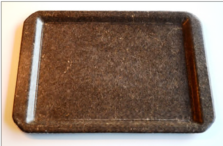
Bild 4 Prototyp eines Kontinenttablets aus Bioverbundwerkstoff auf Basis von epoxidiertem Leinöl und Hanffasern.

Öle (flüssig bei Raumtemperatur) und Fette (fest bei Raumtemperatur) kommen in Tieren und Pflanzen vor. Sie können aus Ölsaaten vergleichs-