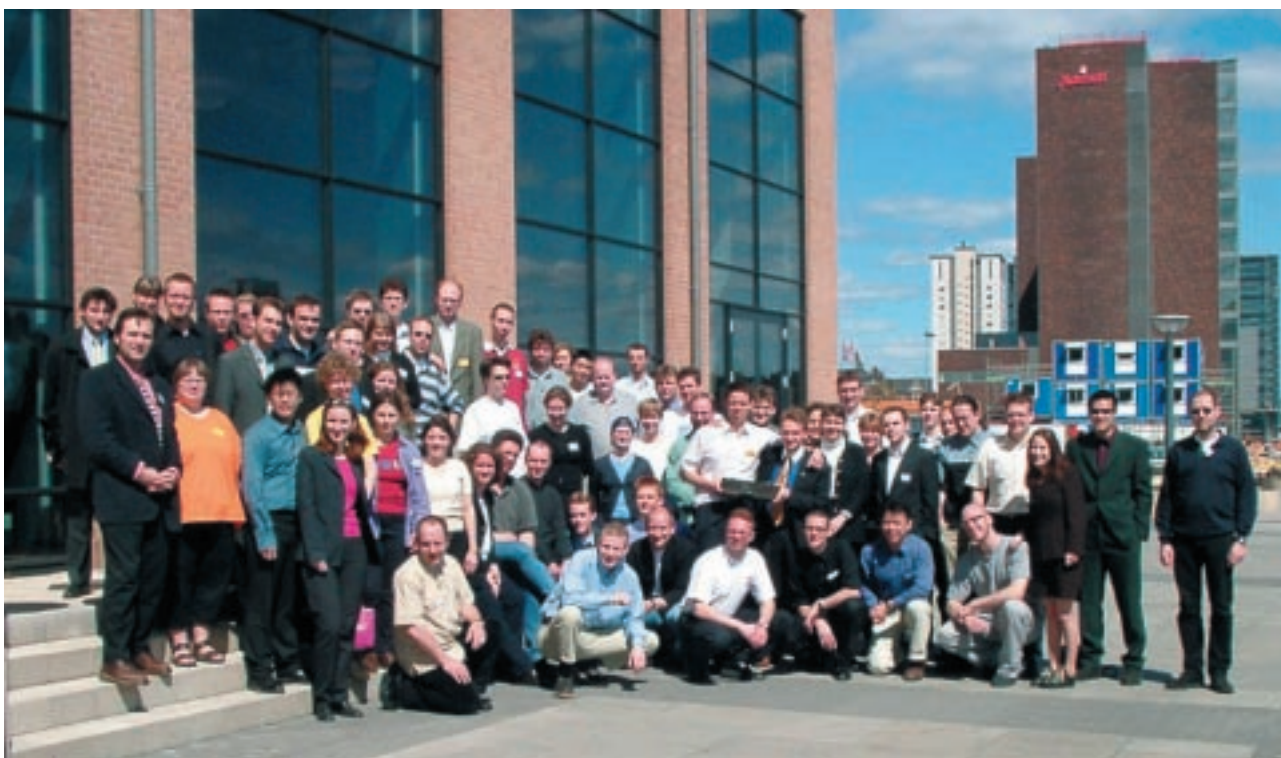
European Young Engineers (EYE) say: »Mange tak, København, farvel! Au revoir à Paris.«