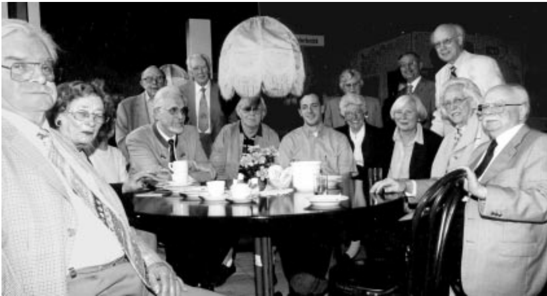
Nach »soviel Wissen hinter den Kulissen« kam uns ein Imbiß im Theaterrestaurant gerade recht.

Viele Beschäftigte am Theater seien mit Leib und Seele dabei, betont Hühne, doch sei schwer, qualifizierten Handwerkernachwuchs zu bekommen. Der Spielbetrieb läuft sieben Tage in der Woche, morgens Proben, nachmittags Aufbau, abends Vorstellung. Nur noch ein gelernter Möbelschreiner arbeitet am Staatstheater; dieser werde von Insidern auch als Künstler geschätzt ebenso wie der Schmied in der Schlosserei, versicherte Hühne. Dort werden 6 bis 7 Meter hohe Gestänge zusammengeschweißt, neuerdings auch aus Aluminium. Für die Kulissen stellt der Transport die größte Belastung dar. Wenn sie erst einmal stehen, wirft sie so leicht nichts mehr um.