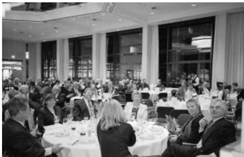
Ruth Wagner, stellvertretende Ministerpräsidentin und Hessische Ministerin für Wissenschaft und Kunst, war als Ehrengast und Rednerin zur VDI Mitgliederversammlung in Wiesbaden eingeladen.

habe diese Fehlentwicklung korrigiert. Durch den Nachtragshaushalt 1999 habe ich eine Verpflichtungsermächtigung für das Jahr 2000 ausgebracht, die dazu führt, daß schon 1999 wieder mehr Stipendien innerhalb der Graduiertenförderung vergeben werden konnten. Im Haushalt